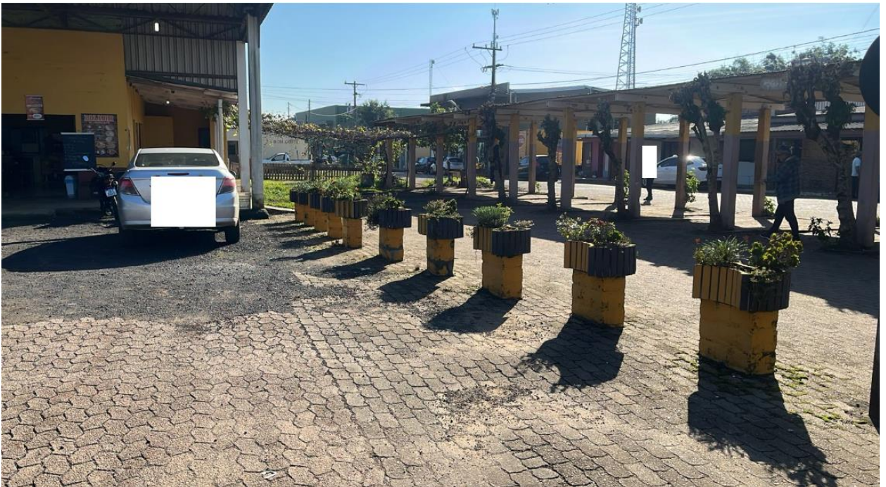
Situação do local