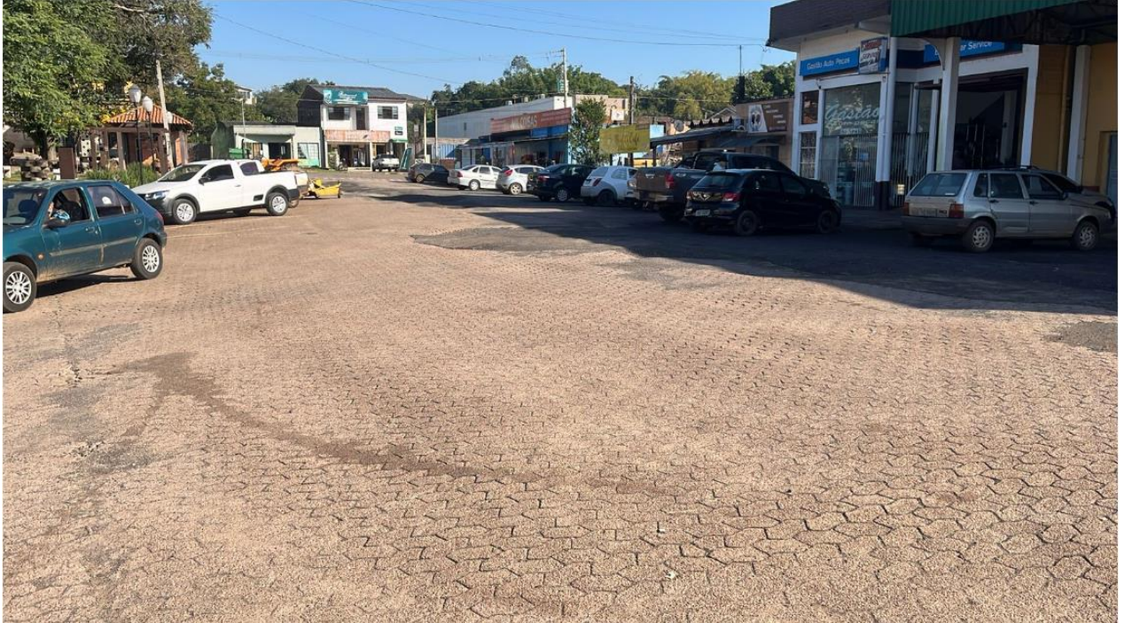
Situação do local