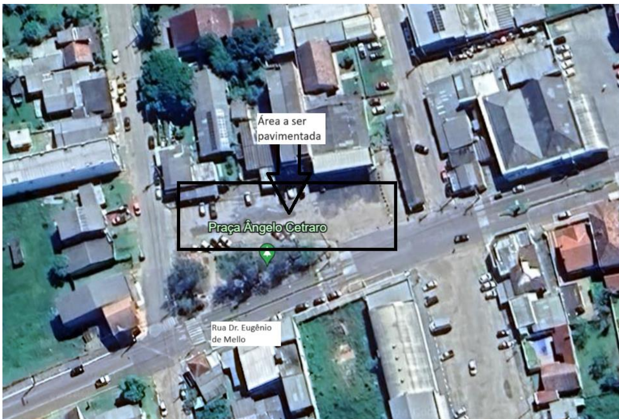
Localização da obra

O solo trata-se de siltitos argilosos, argilosos cinza-escuros, folhetos pirobetuminosos e pequenas camadas de margas e arenitos. Normalmente os poços deste aquífero que captam água somente nessas litologias apresentam vazões muito baixas ou estão secos. As capacidades específicas são geralmente inferiores a 0,1 m 3 /h podendo as águas apresentar grandes quantidades de sais de cálcio e magnésio (CPRM, 2005).