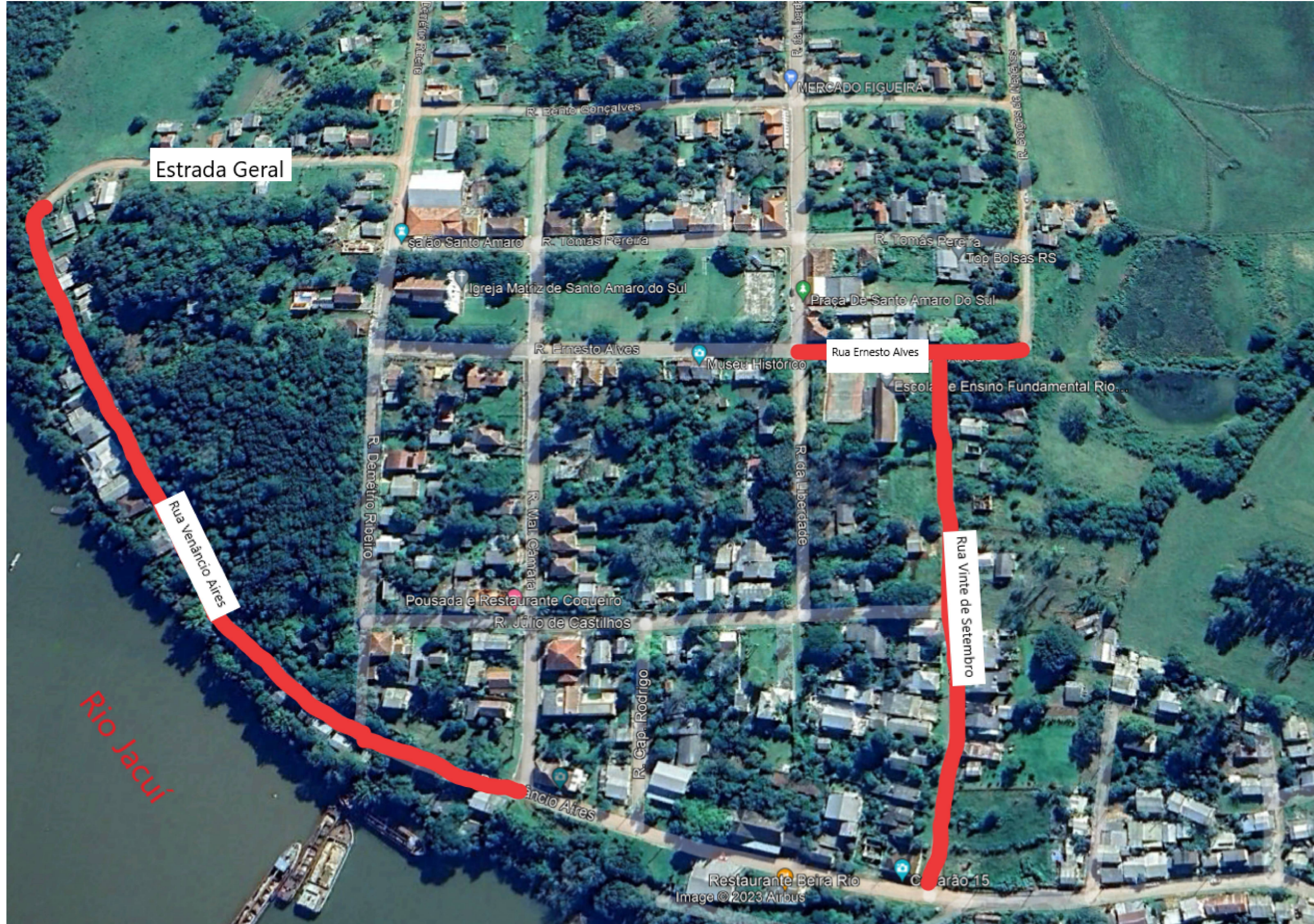
PLANTA DE SITUAÇÃO E LOCALIZAÇÃO