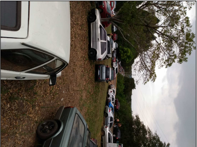
INÍCIO DA RUA