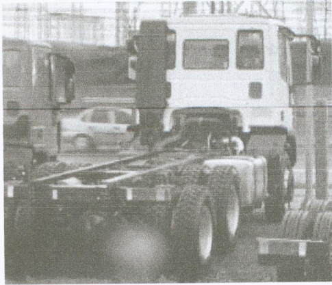
260E30.jpg ~91 KB