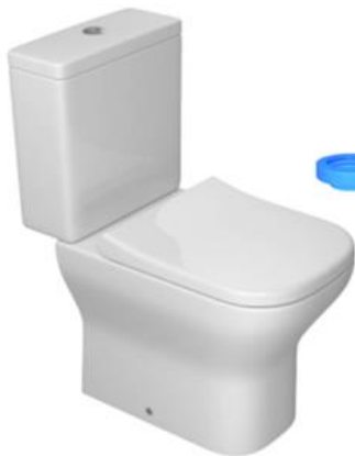
Figura 9 – Bacia Sanitária para PNE

Fornecimento e instalação de Bacia sanitária (DECA ou equivalente) adaptada para PNE ( H=46 cm), sem furo frontal, com caixa de descarga acoplada, inclusive acessórios hidráulicos para condução do efluente até caixa de inspeção, bem como assento da Bacia. Considerar – também – instalação de ralo sifonado no piso do banheiro para eventuais lavagem desse.