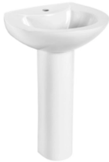
Figura 10 – Lavatório de Coluna

Fornecimento e instalação de Lavatório cerâmico (DECA ou equivalente) com acabamento na cor branca ( H do suporte = 85 cm e Cuba com L= 44 cm e C=35 cm), inclusive acessórios para instalação e funcionamento (tubos e torneira metálica).