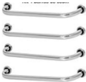
Figura 9 – Barras de apoio

Fornecimento e instalação de Barra de apoio com fixadores para banheiros, fabricada em inox (sanitário PNE), comprimento de 70 e 80 Cm com diâmetro entre 3 a 4,5 cm ( conforme NBR 9050), inclusive fixadores.