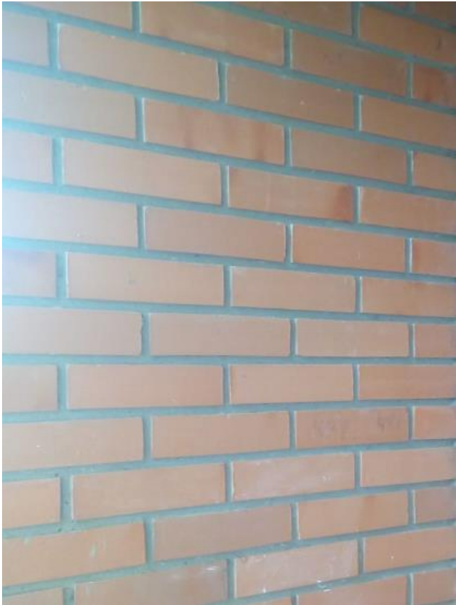
Figura 2 – Parede em tijolo maciço à vista

Execução de parede verticalizada, com tijolo cerâmico maciço (24 x 11,5 x 05 cm), argamassa com com Cimento+Cal+Areia. Considerando que, nas paredes, os tijolos ficaram expostos – é necessário garantir um acabamento perfeito (eliminar eventuais imperfeições, sujeiras), os tijolos deverão apresentar um padrão de acabamento, inclusive com pintura impermeabilizante.