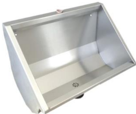
Figura 08 – Mictório em calha inox – 50 cm

Fornecimento e instalação de Mictório em calha inox – 50 cm no Sanitário Masculino.