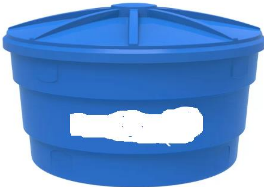
Figura 1 – Caixa D'água em Polietileno

Fornecimento e instalação – sorbe a Laje – de Caixa d'água em Polietileno, inclusive acessórios hidráulicos.