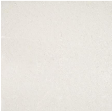
Figura 4 – Porcelanato Acetinado

Fornecimento e execução de Piso em porcelanato acetinado, peças de 60 x 60 cm (Bege), inclusive argamassa e rejuntamento.