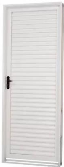
Figura 7 – Porta Metálica 80 x 210 cm

Fornecimento e instalação- na abertura dos Sanitários - de Porta metálica (COMPLETA) 80x210 cm, inclusive os marcos, fechadura (em liga de alumínio com partes de aço) e dobradiças. Considerar - ainda - instalação de barra de apoio para abertura (PNE). Considerar a cor cinza.