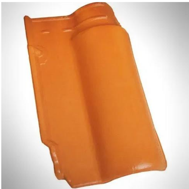
Figura 10 – Telha Cerâmica tipo Portuguesa

Fornecimento e aplicação de telha cerâmica ( Tipo portuguesa) - considerar dimensões para cobertura da Laje (+beiral 40 cm) - telhado de 04 águas (i=15%). Considerar telha já impermeabilizada.