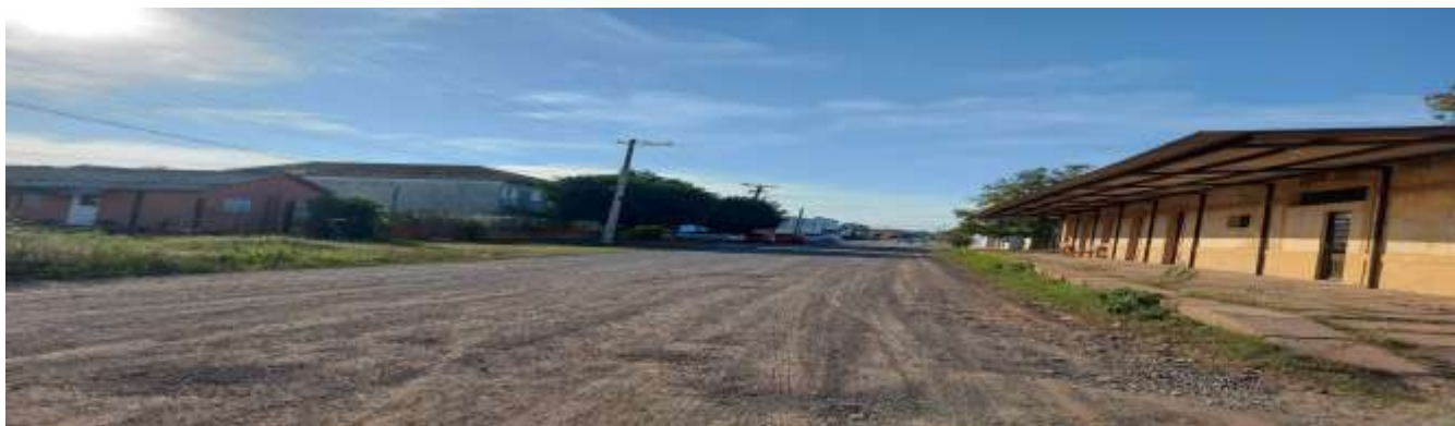
Foto 03/06 - Rua da Estação

Rua: General David Canabarro, 120 – Fone PABX: (51) 3655-1399 Fax: (51) 3655-1351 CEP: 95.820-000 GENERAL CÂMARA – RS CNPJ: 88.117.726/0001-50 e-mail: compras@generalcamara.com