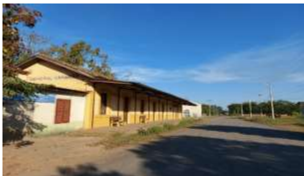
Foto 01/06 - Rua da Estação