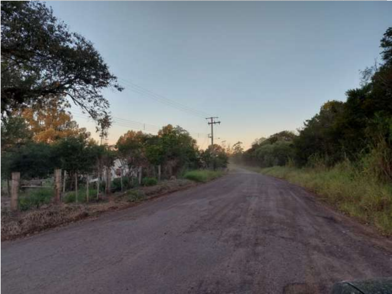
Foto 06/06 – ESTRADA DE ACESSO DE GENERAL CÂMARA AO DISTRITO DE SANTO AMARO (IVALINO JOSÉ MOREIRA)

Elaboração de Projeto de Pavimentação em blocos de concreto intervalados E= 08 cm (Pista de rolamento) e E=06cm (Passeio), incluindo Projeto de drenagem, Planta de sinalização e localização, Especificações técnicas e Planilha Orçamentaria, Memorial descritivo, obras completas e demais documentos pertinentes no tocante à aprovação do processo de pavimentação, bem como o auxílio junto ao Órgão aprovador do trâmite – Caixa Econômica Federal, sobretudo tendo em vista as exigências desse Órgão (Caixa Econômica Federal) para aprovação dos processos.