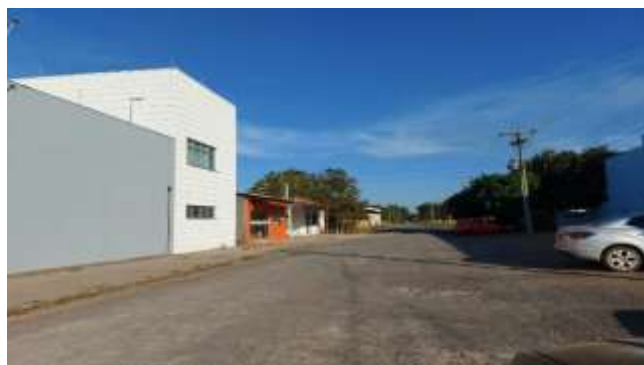
Foto 02/06 - Rua da Estação