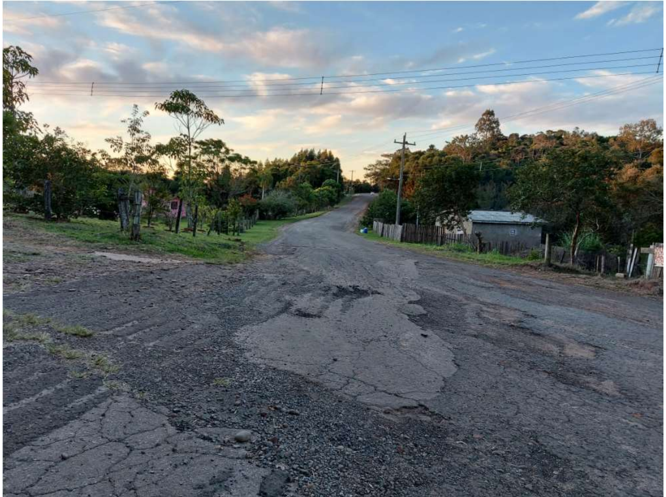
Foto 05/06 – ESTRADA DE ACESSO DE GENERAL CÂMARA AO DISTRITO DE SANTO AMARO (IVALINO JOSÉ MOREIRA)

Rua: General David Canabarro, 120 – Fone PABX: (51) 3655-1399 Fax: (51) 3655-1351 CEP: 95.820-000 GENERAL CÂMARA – RS CNPJ: 88.117.726/0001-50 e-mail: compras@generalcamara.com