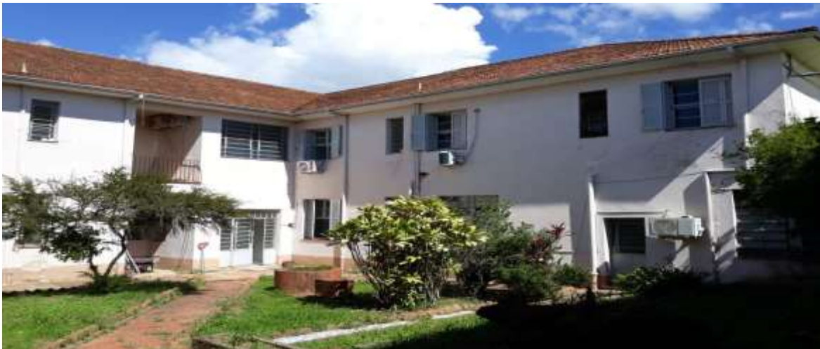
Foto 6/6 – Fachada da Edificação _ lado Oeste (área ao lado da Garagem)

Rua: General David Canabarro, 120 – Fone PABX: (51) 3655-1399 Fax: (51) 3655-1351 CEP: 95.820-000 GENERAL CÂMARA – RS CNPJ: 88.117.726/0001-50 e-mail: compras@generalcamara.com