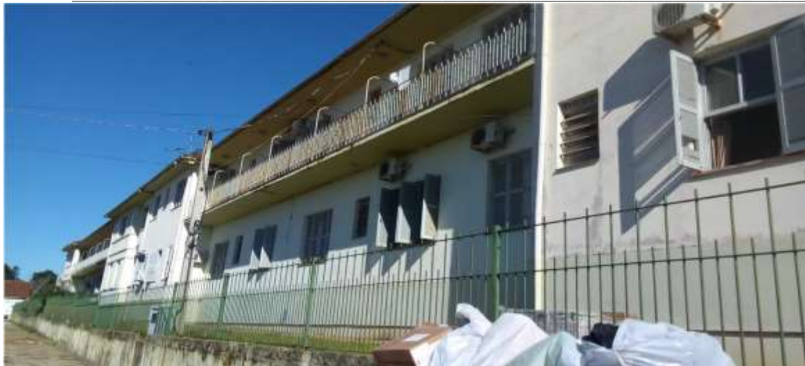
Foto 3/6 – Fachada da Edificação _ paralela à Rua Marquês do Herval