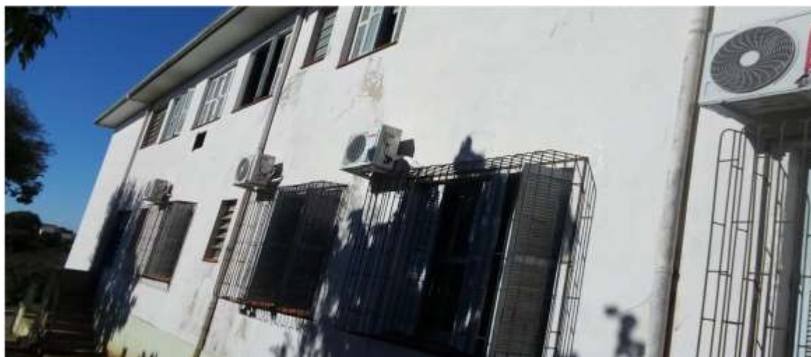
Foto 4/6 – Fachada da Edificação _ perpendicular à Rua Marquês do Herval

Rua: General David Canabarro, 120 – Fone PABX: (51) 3655-1399 Fax: (51) 3655-1351 CEP: 95.820-000 GENERAL CÂMARA – RS CNPJ: 88.117.726/0001-50 e-mail: compras@generalcamara.com