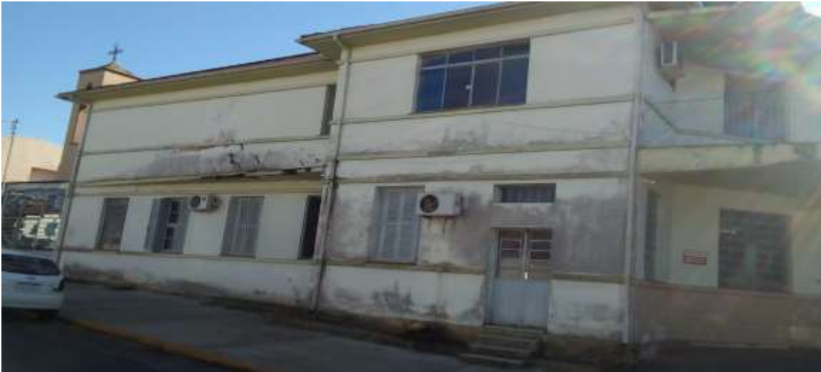
Foto 2/6 – Fachada da Edificação _ paralela à Rua Januário Batista