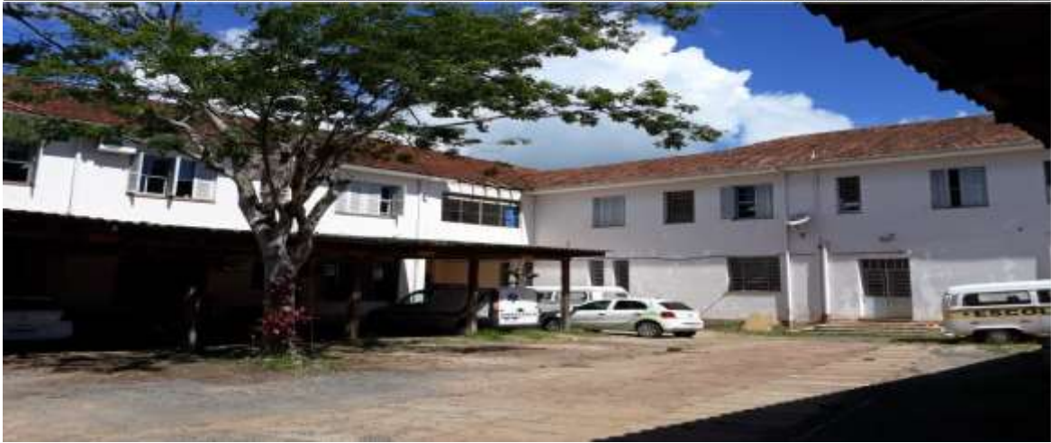
Foto 5/4 – Fachada da Edificação _ lado Oeste (área usada como Garagem dos veículos)