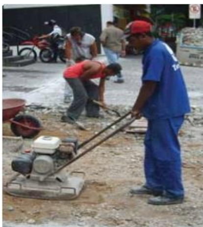
Figura 01 – Compactação do Subleito