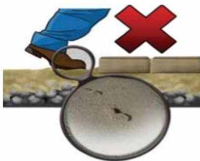
Figura 02 – Não Pisar na Camada de Assentamento

Deve ser utilizada areia média, sem presença de matéria orgânica, seca (cuidar forma de armazenamento), com espessura de camada uniforme e constante para evitar que o pavimento fique ondulado após compactação. Uma vez espalhada, a areia não deve ser pisada nem deixada no local durante a noite ou por períodos prolongados aguardando a colocação dos blocos. Desta forma, deve-se lançar apenas a quantidade suficiente para cumprir a jornada de trabalho prevista para o assentamento dos blocos.