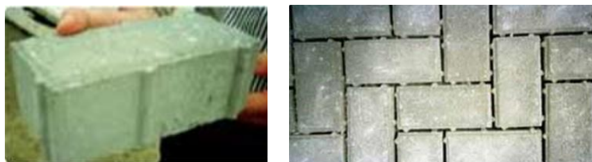
Figura 04 – Blocos com separadores