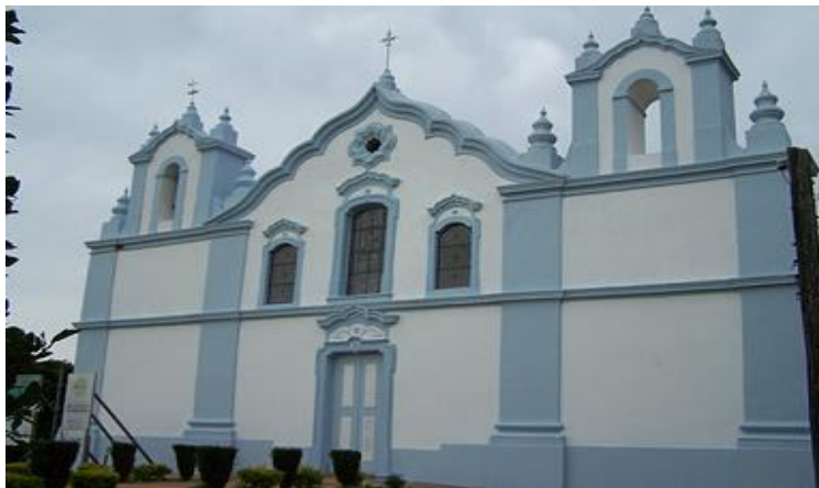
Igreja Matriz de Santo Amaro do Sul

Patrimônio histórico cultural, tombado pelo Instituto do Patrimônio Histórico e Artístico Nacional, IPHAN, o Distrito de Santo Amaro é conhecido pelas belezas arquitetônicas construídas na época dos açorianos.