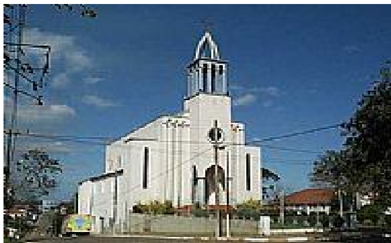
Igreja Matriz de São Nicolau

Igreja Matriz de São Nicolau: Inaugurada no ano de 1945, São Nicolau é o Padroeiro da Cidade. Localiza-se na Rua General David Canabarro.