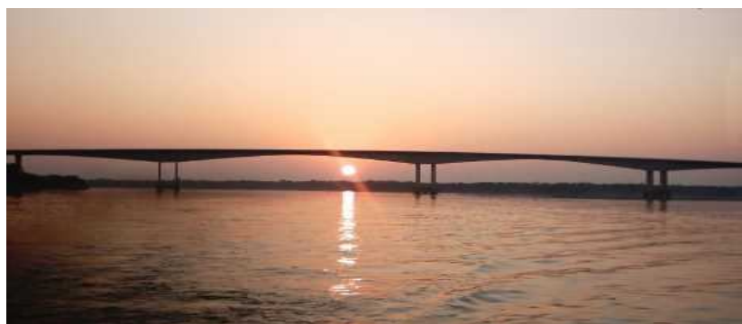
Travessia Lauro Rodrigues, inaugurada no dia 20 de dezembro de 1993