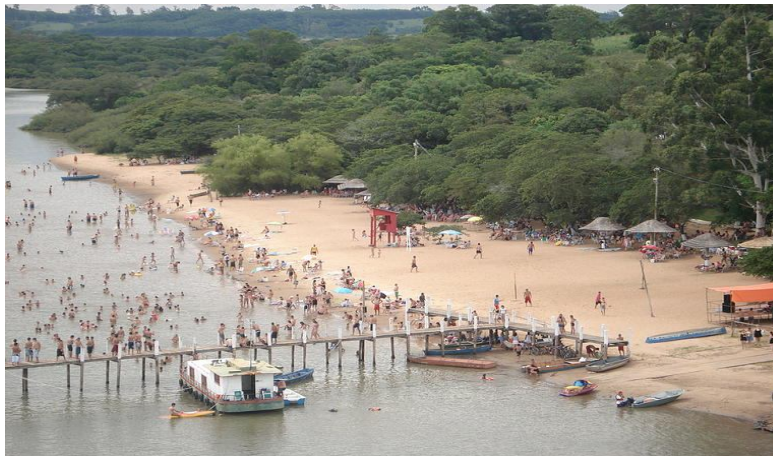
Temporada de veraneio no Balneário da Cachoeirinha