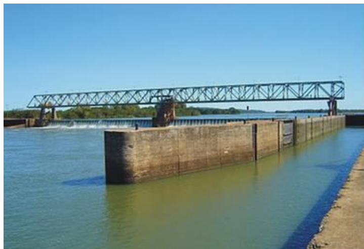
Eclusa Barragem de Amarópolis

Fundada em 1787, esta Igreja é uma referência da arquitetura portuguesa no Estado.