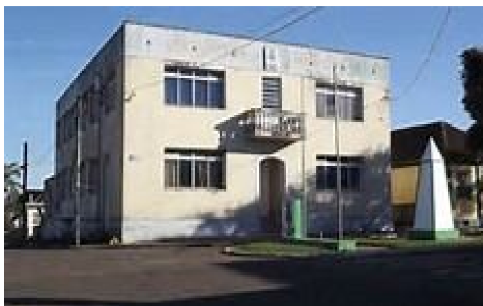
Prefeitura Municipal de General Câmara

Situada na Rua General David Canabarro, nº 120, no centro da cidade